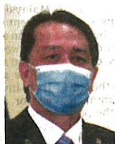
Tan Sri Dr Noor Hisham Abdullah

Up to Wednesday, the Beta variant had led to the highest number of locally transmitted infections nationwide (147 cases), with Selangor alone accounting for 46 cases. Among the VOI, the Theta variant (P.3) contributed the most number of infections, with all 12 locally transmitted cases detected in Sarawak.