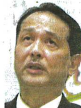
Dr Noor Hisham Abdullah

Kes harian tertinggi direkod bulan lalu adalah 8,209 pada 3 Jun, namun angka itu menurun ke paras terendah, iaitu 4,611 pada 21 Jun, namun kes kembali meningkat selepas itu kepada 6,437 pada 29 Jun dan 6,276 pada 30 Jun.