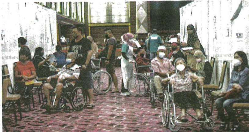
PROSES vaksinasi yang dikendalikan oleh sukarelawan QueMeds di Pusat Pemberian Vaksin (PPV) di Ideal Convention Centre Shah Alam, baru-baru ini.

"Ia terdiri daripada Kluster Dah Batik Industri Sungai Petani